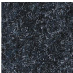
1535 Midnight Navy

Revêtement de sol textile aiguilleté plat. Passage intensif - Idéal pour magasins, bureaux, collectivités, espaces accueils... Classe d'usage : 33 (en pose collée)