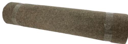
Rouleau de 1 x 10 m

Coloris variables dans la gamme des beige-marron