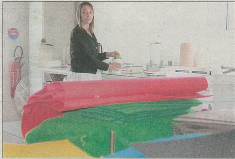
Dans le labo de l'usine, on teste de nouvelles matières, de nouvelles couleurs, réalisées à la demande.